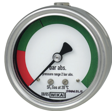
Wskaźnik gęstości gazu model GDI-063